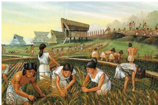
Document 4 : Illustration montrant les premières cultures lors du Néolithique

Au début, les hommes étaient nomades : ils allaient chercher leur nourriture en chassant, pêchant ou cueillant. Puis, il y a environ 10 000 ans , certains ont commencé à cultiver des plantes et élever des animaux au même endroit.