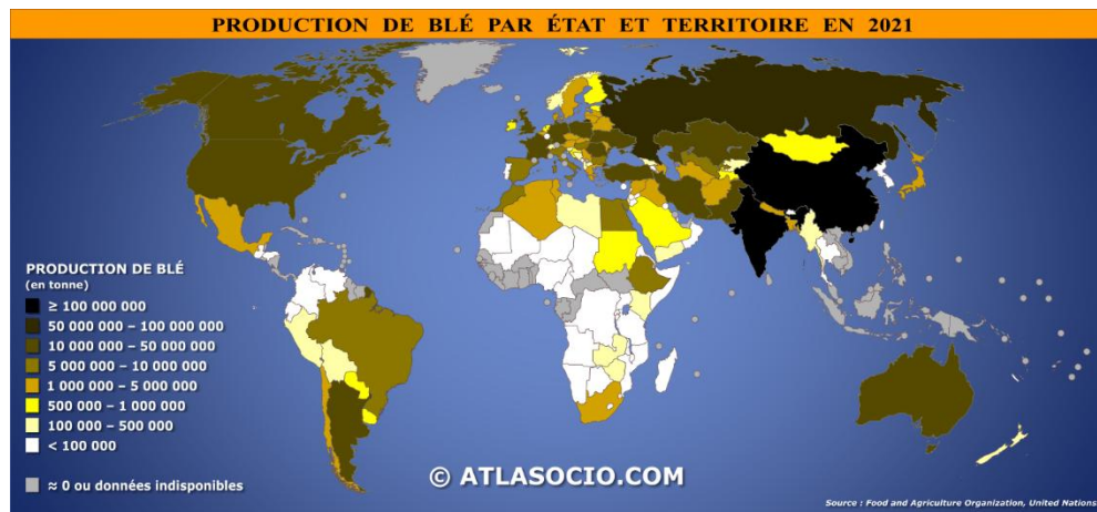
Document 1 : Carte de la production de blé en tonne en 2021